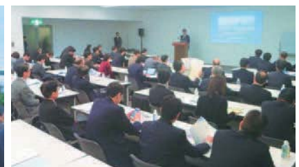
大阪ベイエリア現地見学会 (2016年3月18日) Osaka Bay Area Observation Tour and Information Seminar (March 18, 2016)