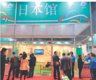
中国国際工業博覧会 (2015年11月3日~7日) China International Industry Fair (November 3 to 7, 2015)