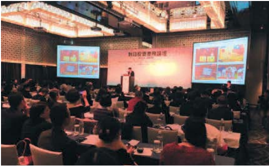
台湾での対日投資セミナー（台湾） (2015年12月21日) Invest Japan Seminar in Taiwan (December 21, 2015)

International Affairs Department, Investment Promotion Project