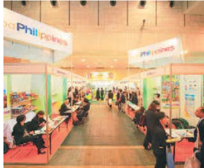
フィリピン経済ミッション (2015年10月13日~17日) Philippine business delegation (October 13-17, 2015)