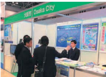
「バッテリージャパン2016」 (第7回【国際】二次電池展) 出展 (2016年3月2日～4日) Battery Japan 2016 (March 2 to 4, 2016)