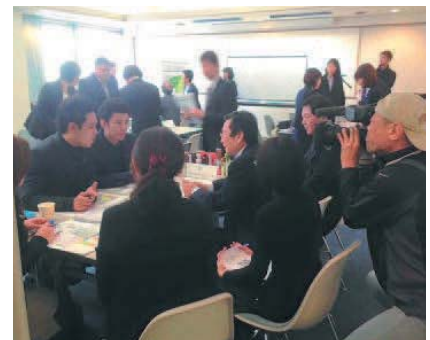
タイ国コスメティック商談会 (2016年1月19日) Thailand Cosmetics Business Matching (January 19, 2016)