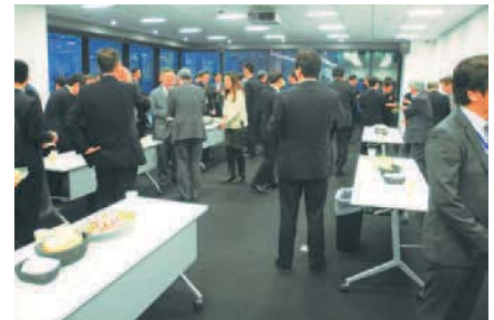
大阪立地プロモーションセミナー (2016年1月26日) Osaka Investment Promotion Seminar (January 26, 2016)