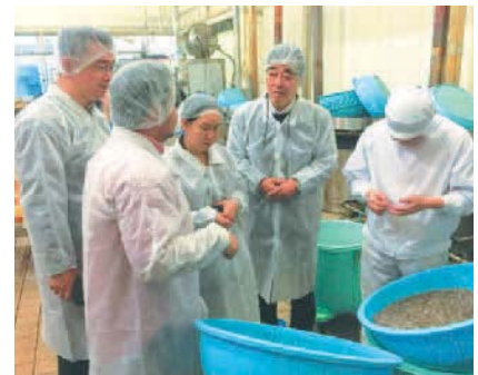
BPC人材研修プログラム (2016年2月29日~3月11日) BPC training program in Osaka (February 29- March 11, 2016)