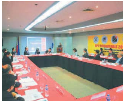
BPCラウンドテーブル 2015 マニラ (2015年10月15日) BPC Roundtable 2015 Manila (October 15, 2015)