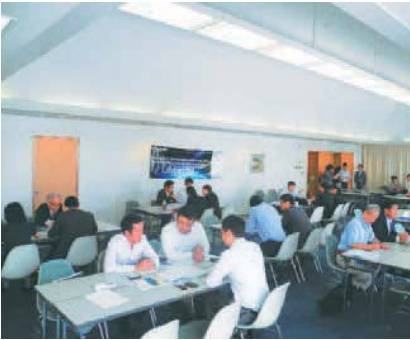
ベトナムIT商談会 in 大阪 (2015年9月4日) Vietnam IT Business Matching in Osaka (September 4, 2015)