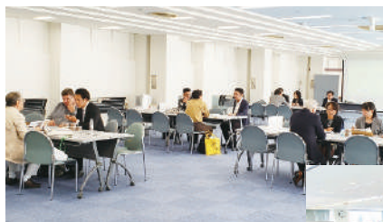
2019/9/26 インドネシア・バイオマス 商談会2019(大阪) Indonesia Biomass Business Meetings 2019 in Osaka