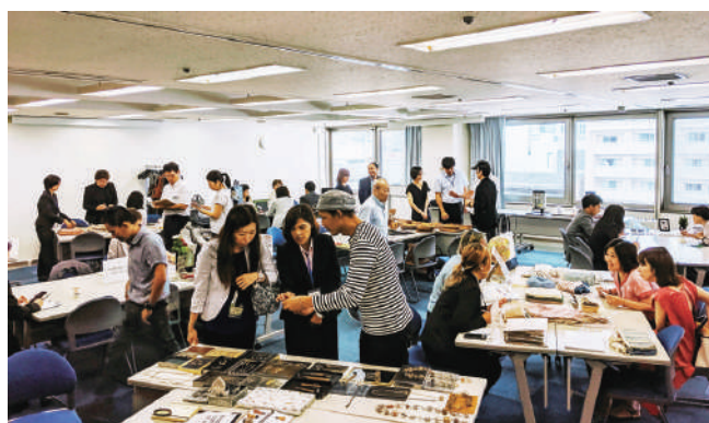
2019/7/26 タイ・スタイルエコプロダクト商談会2019 Thai Style Eco-Products Business Meetings 2019 in Osaka