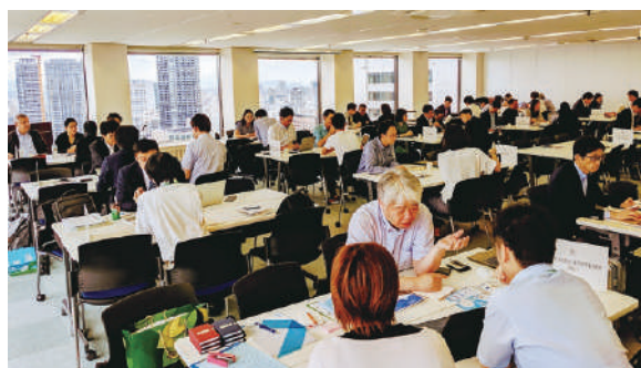
2019/7/9 ベトナム IT 商談会2019 (大阪) Vietnam IT Business Meetings 2019 in Osaka

International Affairs Department, Economic Exchange Project