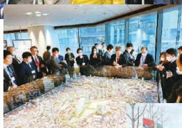
2020/2/14 大阪ビジネスツアー Osaka Business Tour