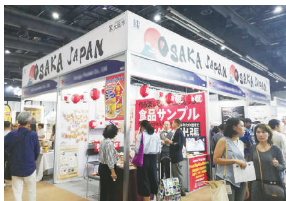
2019/9/4~7 フード & ホテル タイランド 2019 Food & Hotel Thailand 2019