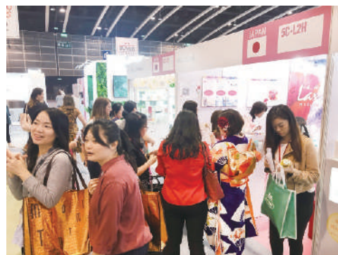
2019/11/13~15 コスモプロアジア2019 Cosmoprof Asia 2019