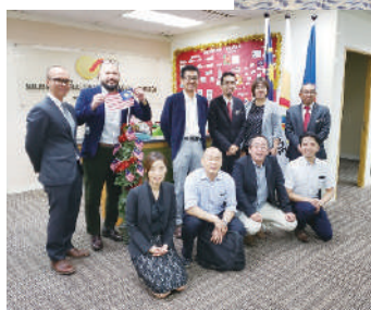
2019/11/20~22 マレーシア・クアラルンプール市 企業ミッション団派遣 & 現地商談会 Malaysia Kuala Lumpur City Business Delegation & Business Meetings