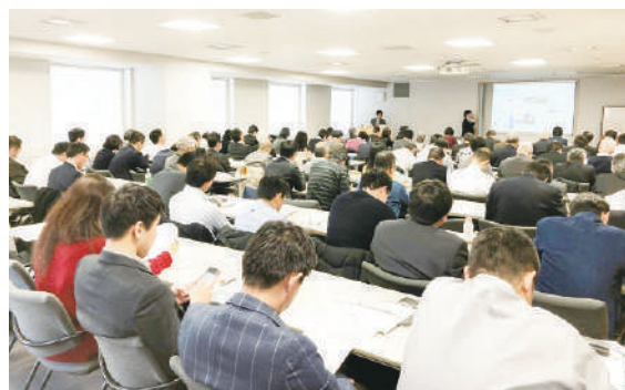
2019/12/12 中国シルバービジネスチャンスセミナー2019 China aged-care Business chance Seminar 2019