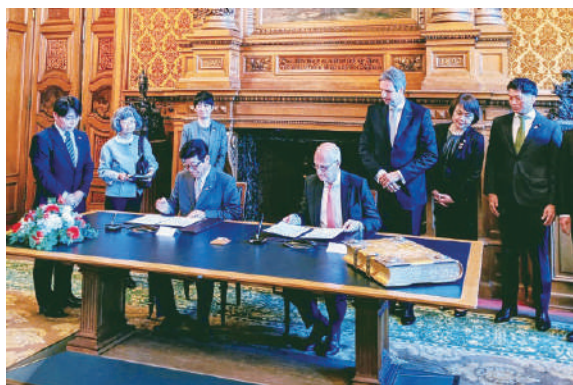
2019/9/23 ハンブルク商工会議所とのビジネスパートナー都市提携 Business Partner City (BPC) agreement with the Hamburg Chamber of Commerce

Osaka Business Partner City Council (BPC Council)