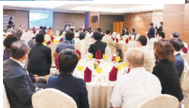
2019/11/21 BPC ラウンドテーブル 2019 クアラルンプール BPC Roundtable 2019 Kuala Lumpur